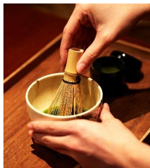
単なるお茶を飲む行為ではなく、心を落ち着け、自然との調和を感じる時間です。