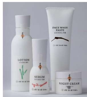
chi to sé trueからのおもてなしとして、福鈴リチュアルをご用意しています。